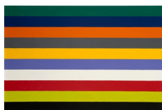
Poul Gernes Uden titel , 1966-67 Lakmaling på masonit 122 x 182 cm