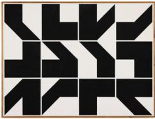
Gunnar Aagaard Andersen * VÆGAVIS. DEN RETTE, DEN STUMPE OG DEN SPIDSE VINKEL, 1971 Oil on canvas 130.0 x 97.0 inch.decimal