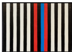
Albert Mertz * Sort/hvid/rød/blå , 1988 Akryl på plade 73 x 103 cm