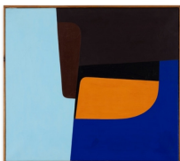
Ib Geertsen Komposition med orange og lilla , 1955 Olie på lærred 80 x 90 cm