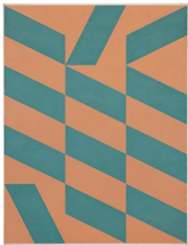
Gunnar Aagaard Andersen * HÆLDNINGSKOEFFICIENT 2, 1961 Oil on canvas 130.0 x 97.0 inch.decimal