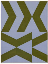
Gunnar Aagaard Andersen * HÆLDNINGSKOEFFICIENT 2, 1961 Oil on canvas 130.0 x 97.0 inch.decimal