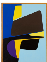
Ib Geertsen Komposition , 1956 Oil on canvas 105 x 80 cm