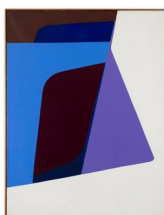
Ib Geertsen Komposition lys - mørk , 1956 Olie på lærred 105 x 80 cm